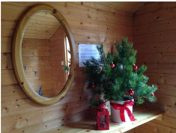
Toalettet i Norddal, julepynta toalett på Taustua i Sula og måling av toalettet i Kråkvika i Vestnes.