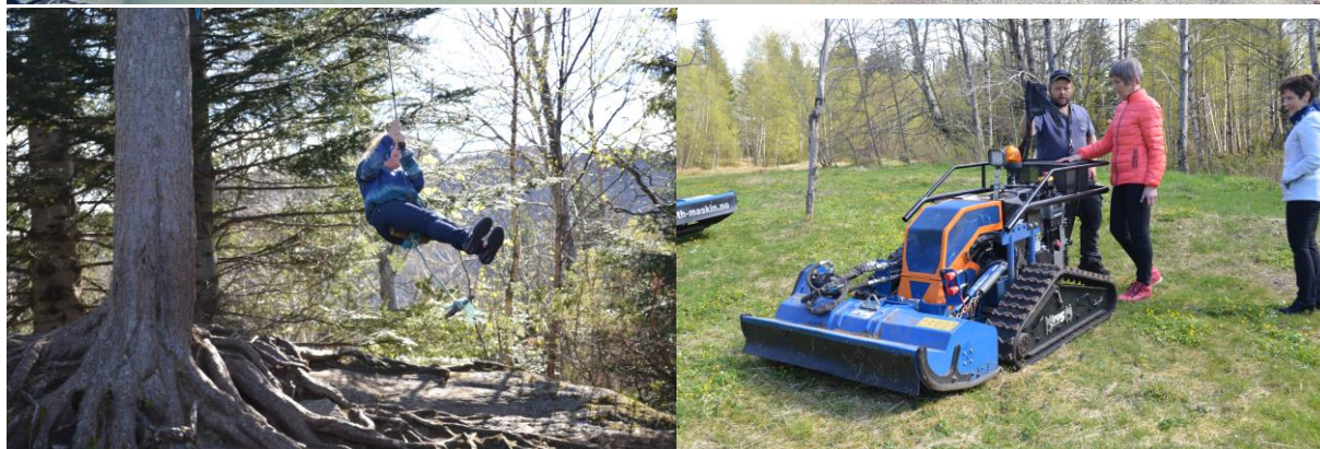
Frå besøket av fylkeskulturkomiteen i Stafsethneset friluftsområde i Ålesund i mai.

I mai inviterte vi Kultur- og folkehelsekomiteen i fylkeskommunen på besøk og omvising i Stafsethneset friluftsområde i Ålesund. Der fekk vi m.a. vist fram den nye badestranda med skjelsand og demonstrert kvifor ein beitepussar er viktig i skjøtselsarbeidet i friluftsområda.