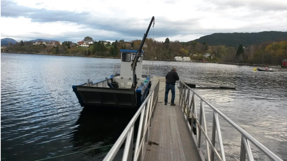
Reparasjon av flytebrygge på Stafsethneset i Ålesund.

Friluftsrådet leiger to arbeidsbilar. Aktivitetsleiar disponerer den eine og driftsleiar den andre. Frå oktober 2015 leiger vi også ein Irus beitepussar som vi håper å få midlar til å kjøpe i 2016.