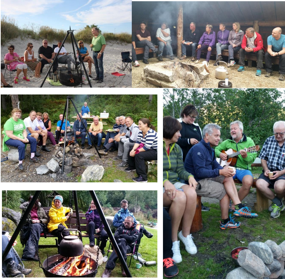
Glimt frå nokre av bålsamtalane i medlemskommunane før valet.

Besøka i kommunestyra i medlemskommunane, bålsamtalane, det omfattande samarbeidet med frivillige og tilsette i kommunane, all medieomtalen, samarbeidet med andre frilufsorganisasjonar og Stikk UT! har gitt gode resultat. Langt fleire enn tidlegare kjenner no til friluftsrådet og kva vi arbeider med.