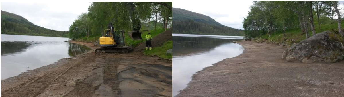
Den nye sandstranda i Gurinesbukta på Vatne i Haram vart ferdig i 2015. No manglar berre badeflåte.....

Friluftsrådet tek ansvar for å søke om midlar til skjøtsel og tilrettelegging i alle dei statleg sikra friluftsområda i medlemskommunane. I 2015 vart det sendt 14 søknader, det same som i 2014. Det vart tilslag på 12 (8 i 2014) med eit samla tilskot på kr. 1 226 000 (765 000 i 2014). Tiltaka i Skråvika i Ålesund vart ikkje ferdig i 2015 fordi kommunen er forsinka med sin del av arbeidet. Dette prosjektet er derfor overført til 2016.