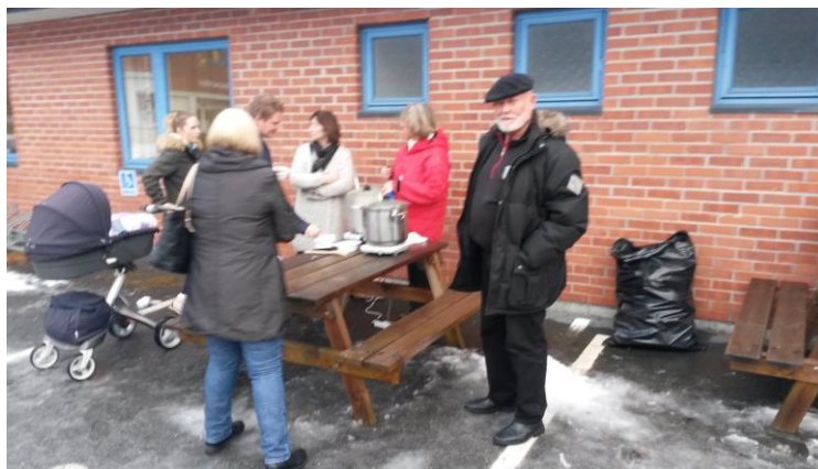
Glimt frå opningsarrangementa i Ørskog, Haram og Skodje.