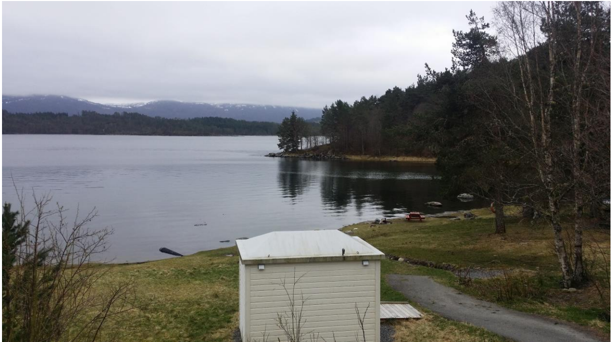
Murvika i Skodje.