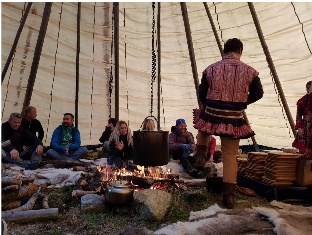
Den samiske festmaten Bidos vart inntatt på tradisjonelt vis.