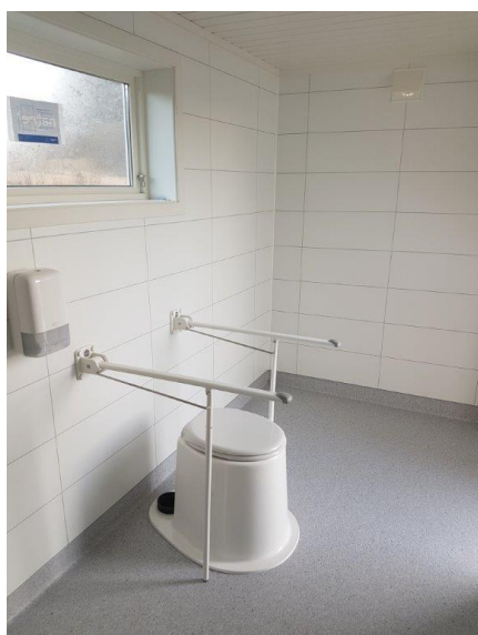
Vinterøpe toalett på Tueneset.