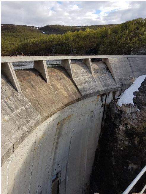
Besøket ved Altakraftverket var ei interessant oppleving. Tidlegare stortingsrepresentant Odd Einar Dørum fortalte om kampen før utbygginga.