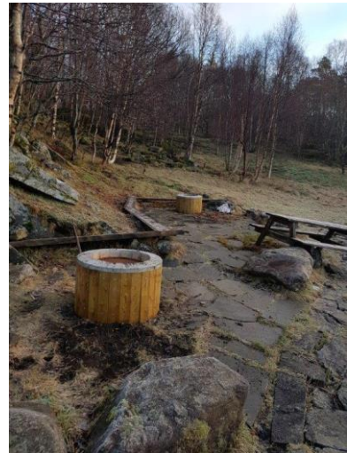
Nye grillar på Svinøya.