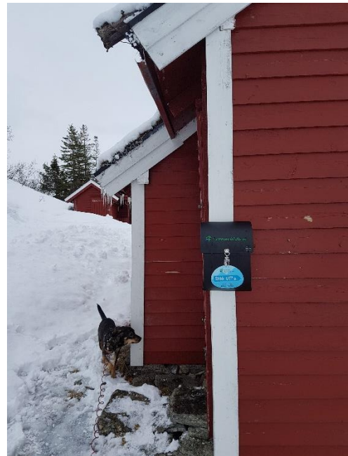
Storvasshytta i Stordal.