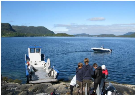
Rapporten frå Runde Miljøsententer.

Samarbeidsprosjekt mellom Runde Miljøsententer og Sunnmøre Friluftsråd