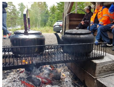
Så mange kjem at det trengs to kaffikjelar!