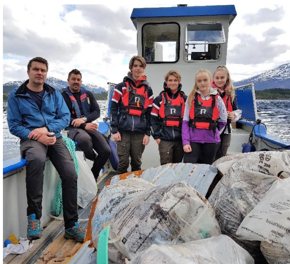
På eit par timar vart dekket på arbeidsbåten fullt.

Det er viktig for friluftsrådet å vere synleg i media, både radio og TV, trykte- og sosiale media. Slik når vi ut til mange og får informert om arbeidet vårt og kva vi kan tilby innbyggjarane i medlemskommunane. Den 3. mai var vi med frå Murvika i Skodje på den direktesendte nasjonale radio- og TV-sendinga til NRK om marin forsøpling.