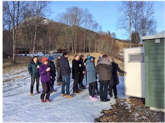
Mange vart overraska over standarden på toalettet.