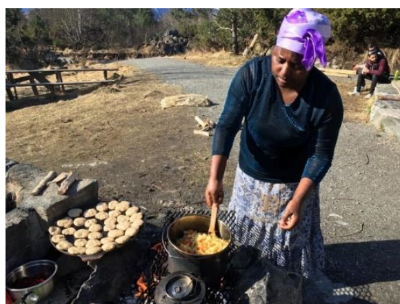
Matlagjing på høgt nivå ved Tuehuken på Tueneset i Ålesund.