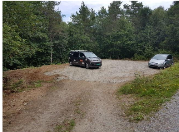
Krattrydding og opprusting parkeringsplass Leirvågen.