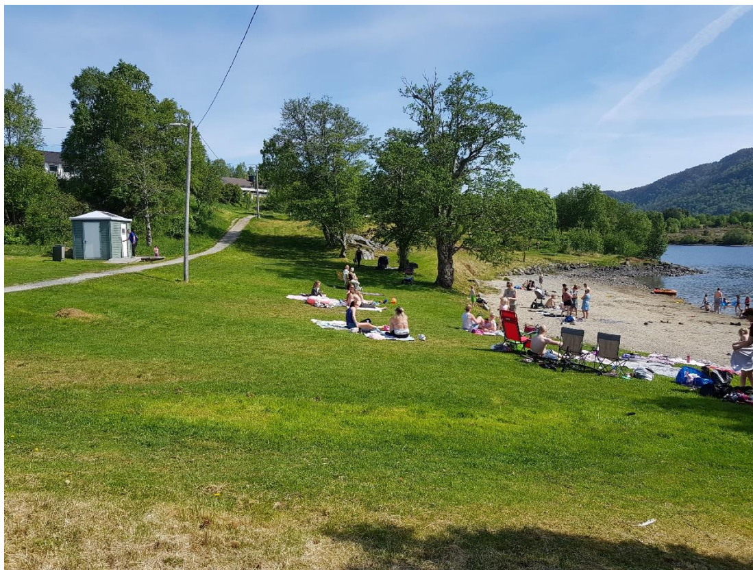
Sommardag ved Vassetvatnet i Sula. Toalettet til friluftsrådet oppe til venstre.