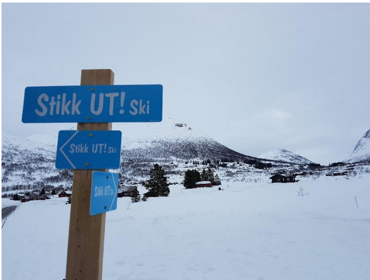
Skilting i Stordal.