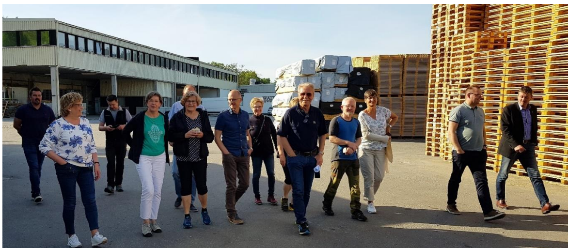
Synfaring for å sjå på arbeidsbåten og vurdere mogleg kjøp av naust. Bålkaffi høyrer med!

I kvart styremøte har det også vore orienteringar om aktuelle saker og spørsmål friluftsrådet har arbeidd med gjennom året. I tillegg har fleire i styret deltatt på synfaringar, møter og konferansar i 2018, og dåpsarrangementet til skjergardstenestebåten «Rigmor».