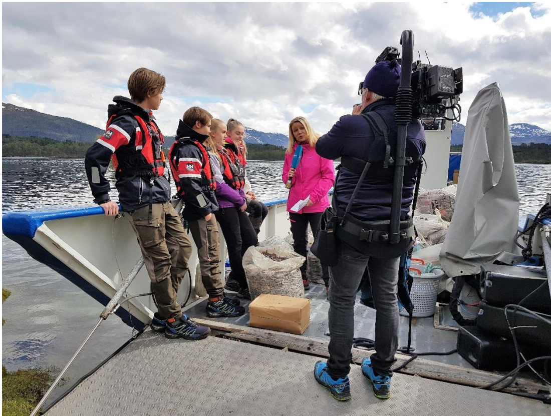
Litt nervepirrende å bli intervjuet direkte på TV, men det gikk veldig fint.