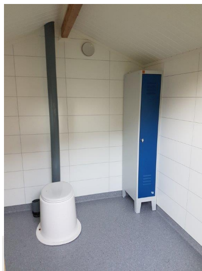
Toalettet på Storholmen før og etter.