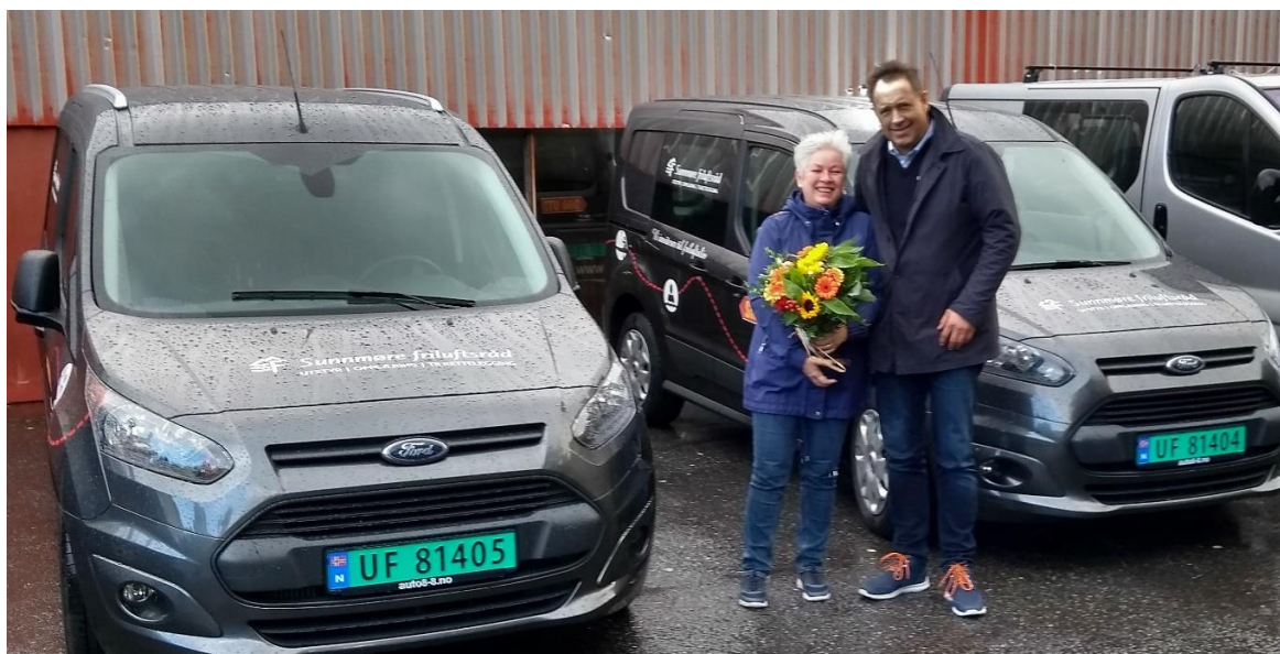
Besøk og blomster frå Ford, som friluftsrådet leiger to av dei nye arbeidsbilane av.