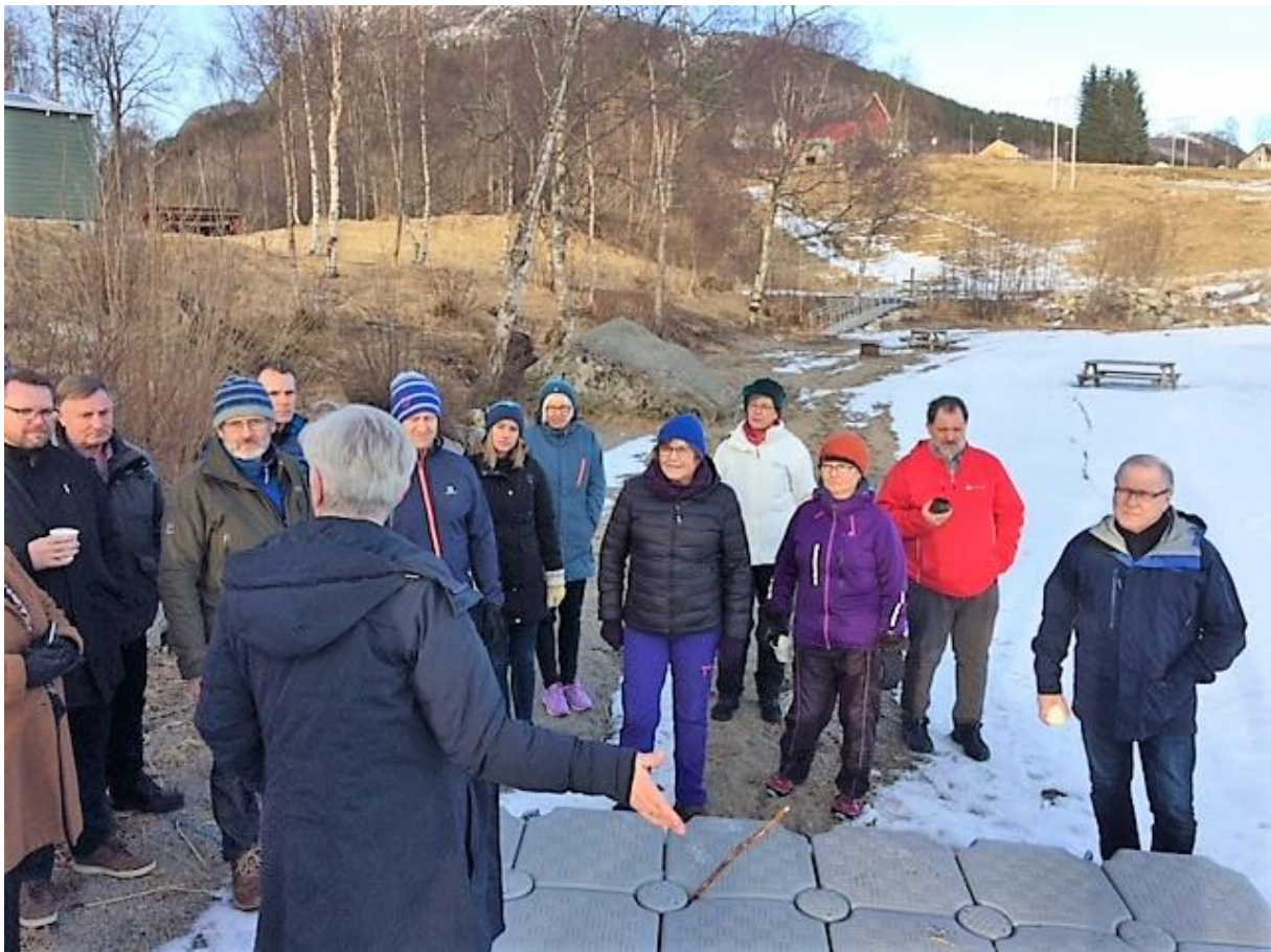
Så tidleg i mars var det framleis is på vatnet. Men om sommaren er badebrygga flittig i bruk. Den blir tatt opp på land kvar haust og lagt ut att før sommaren.