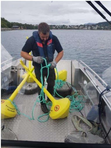
Utsetting av badebøyer.