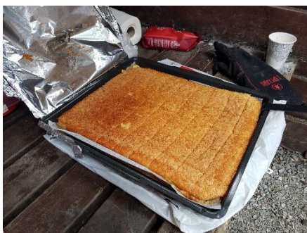
Heimebakst kvar onsdag i Kråkvika i Vestnes.

Naturmøteplassen er eit prosjekt vi tok initiativ til i 2016. I 2018 var tre i sving heile året: Kråkvika i Vestnes, Aksla i Ålesund og Bugardsmyrane i Ulstein. Dette eit samarbeid med tilsette i kommunen og frivillige. Målet er at Naturmøteplassane skal vere faste møteplassar i friluft gjennom året for folk som har ledig tid på dagtid. Friluftsrådet ønskjer å få etablert Naturmøteplassar i fleire av medlemskommunar.