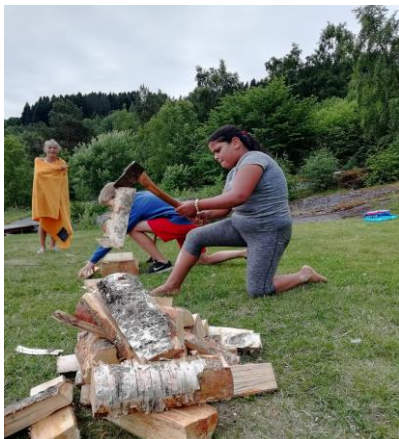
Å meistre øks er viktig kunnskap.

Friluftsrådet har som mål å gi barn og unge tilbud om aktivitet på fritida, der dei får prøve ut ulike friluftaktivitetar og bli betre kjent med kva dei kan finne på i eige nærmiljø. Her har vi eit tett samarbeid med lag og organisasjonar, som er dei som driv mykje av aktiviteten gjennom året.