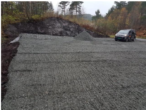
Opprusta parkeringsplass Håhjem.