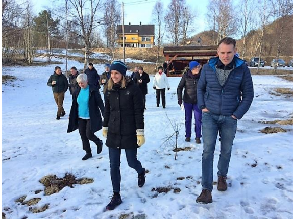
På tur ned mot toalettet og stranda.