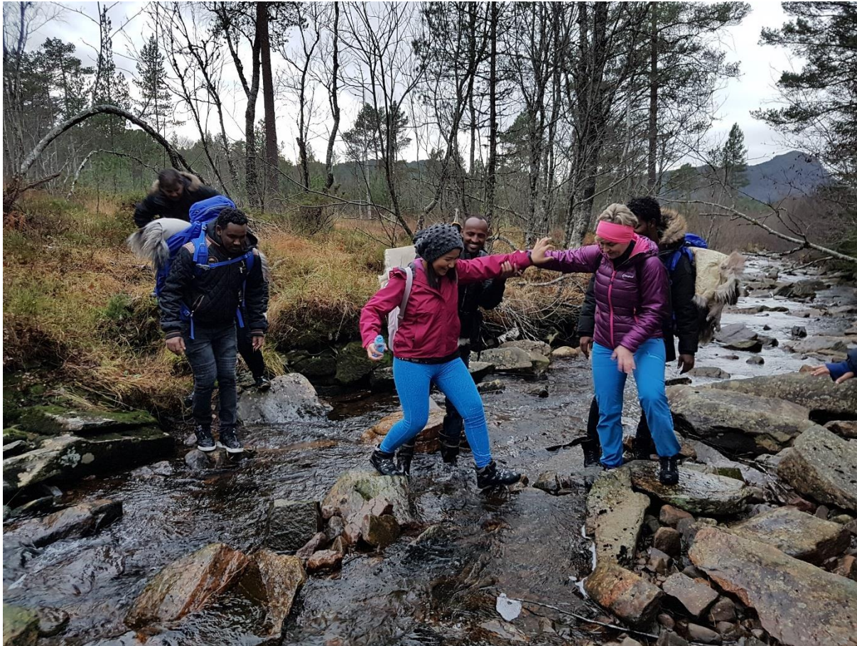
Frå turen til Skodjestølen, med skog og sporlaus ferdsl som hovudtema.

Også i 2018 fekk friluftsrådet midlar til tiltak for å introdusere norsk friluftsliv til folk som er nye i landet. Fordi asylmottaka var avvikla, valte vi i år å fokusere på folk som har fått opphald og blir verande i landet.