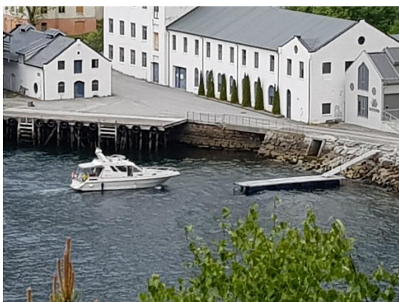
Brygga på Dyrkorn i Stordal.

Friluftsrådet søkjer på vegne av rådet og kommunane om skjøtsel- og tilretteleggingsmidlar til dei statleg sikra friluftsområda.