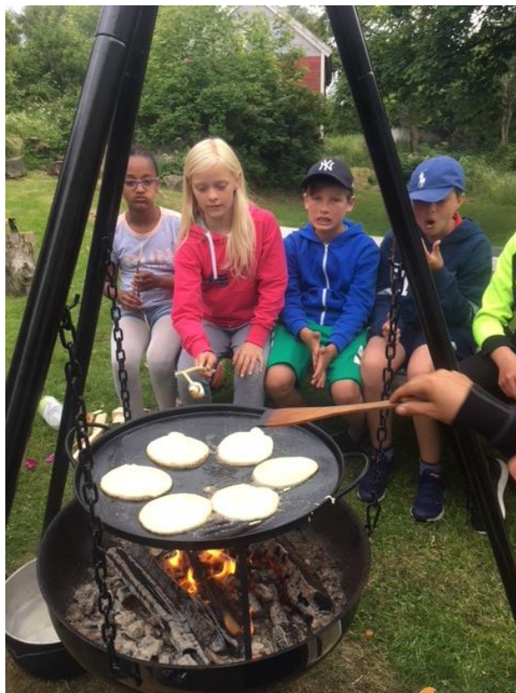
Sveler smakar alltid godt! Her frå overnattingsturen til Borgarøya for deltakarane på Ulstein friluftsskule.

I tillegg låner friluftsrådet ut kajakkar og anna utstyr til lag og foreningar som arrangerer aktivitetstilbod til barn og unge på fritida.