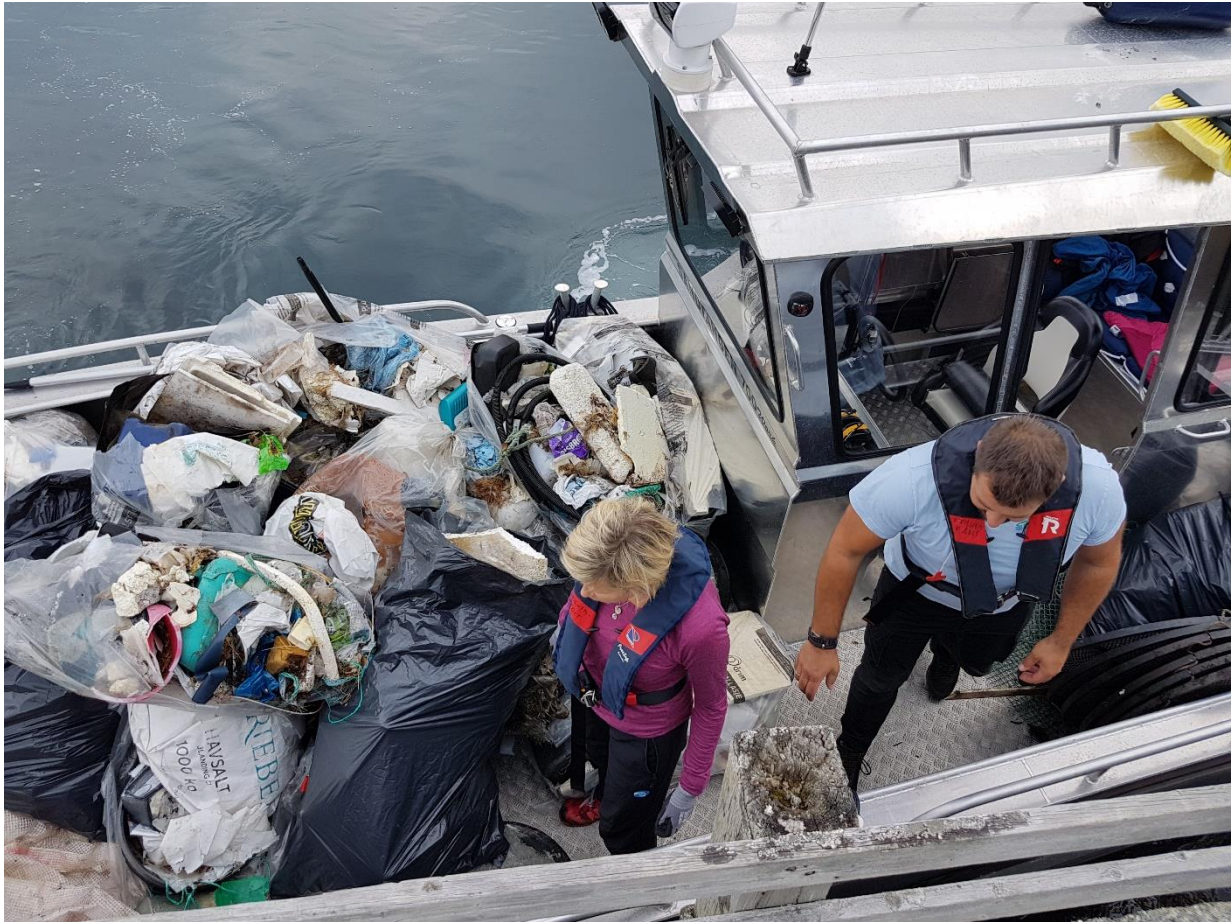
Nokre timars arbeid - og båten er full.