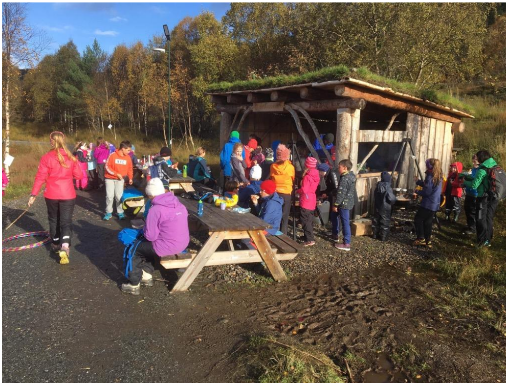
Glimt frå Kom UT i Bugardsmyrane i Ulstein i haustferien.