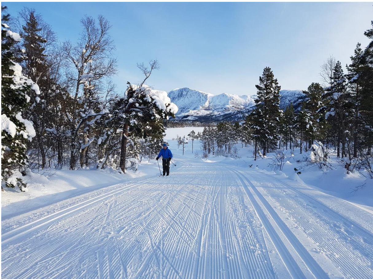
Vintereventyret i Svartløkenområdet.