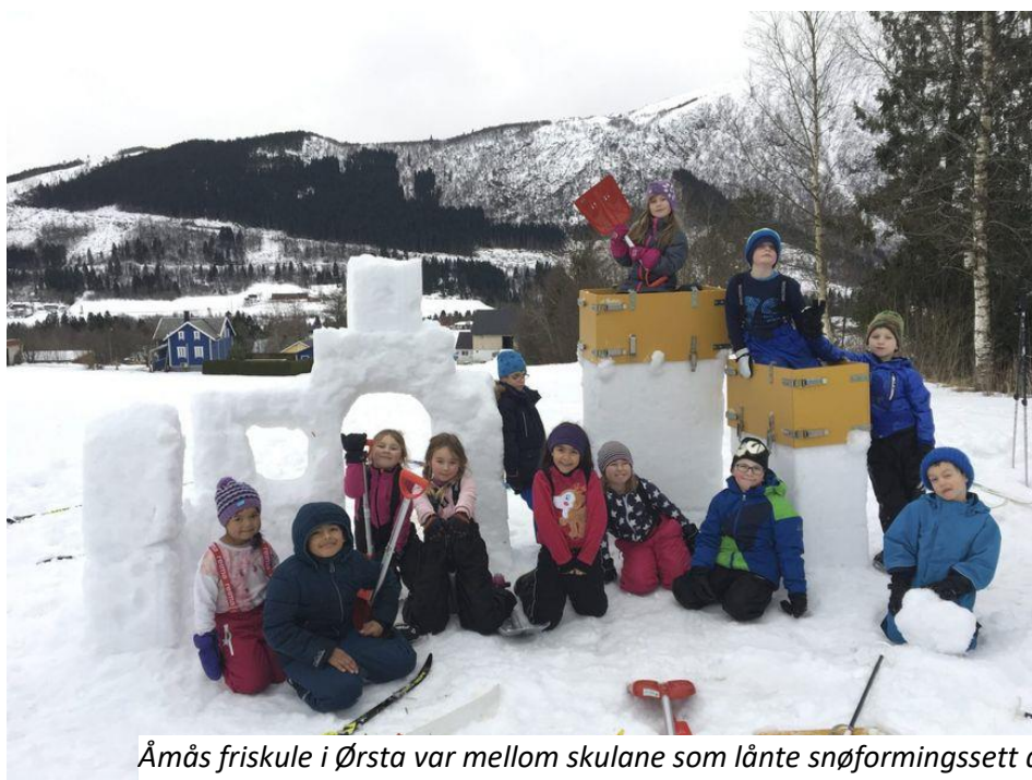
Åmås friskule i Ørsta var mellom skulane som lånte snøformingssett av friluftsrådet i 2018.