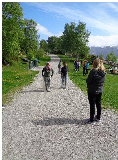
Sekkeløp 16. mai.