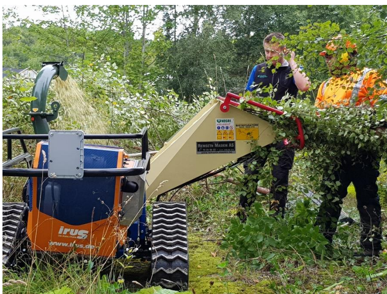
Testing av ny beitepussar med fliskuttar – inkludert utelunsj.

Dei siste åra har friluftsrådet også hatt leasingavtale på ein Irus beitepussar til bruk i driftsarbeidet. Også der har vi inngått ny avtale i 2018, og skifta til ein nyare modell med fliskuttar i tillegg, utan nemneverdig auke i leigeprisen.