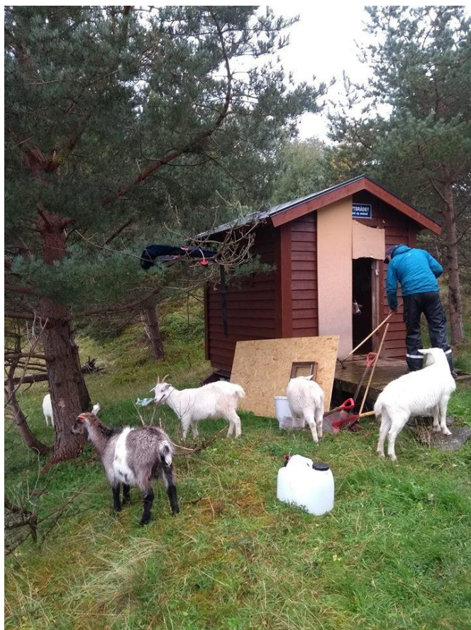
Kjekt med interessert selskap til arbeidet.