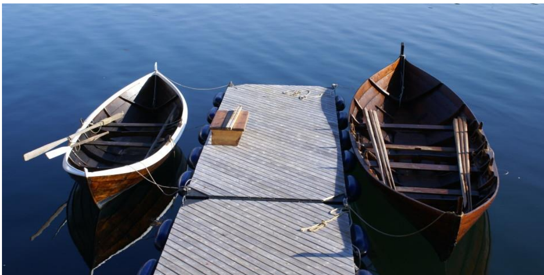
«Linge» til venstre og «Leia» til høgre.

Dei to færingane friluftsrådet eig, Leia og Linge, ligg ved Sunnmøre Museum. Dei blir leigde ut i samarbeid med museet og Sunnmøre Kystlag, både til private og til lag og foreiningar. «Linge» har plass til 4 personar og kostar berre kr. 150 å leige ein dag. Med overnatting og lavvo blir prisen kr. 350. Same prisane gjeld for «Leia», som har plass til 6 personar. Dei som vil leige robåtane må ta kontakt med museet.