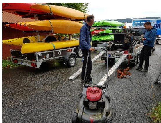
Straks klart for driftsrunde med grasklipping.