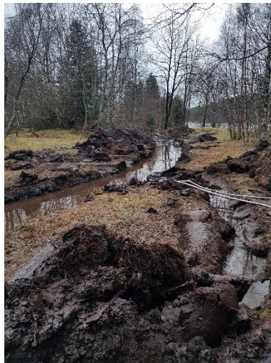
Drenering av slåttemark.