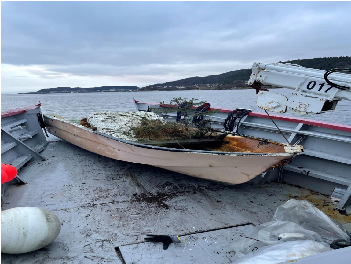
Innhenting av gammel herreløys båt.