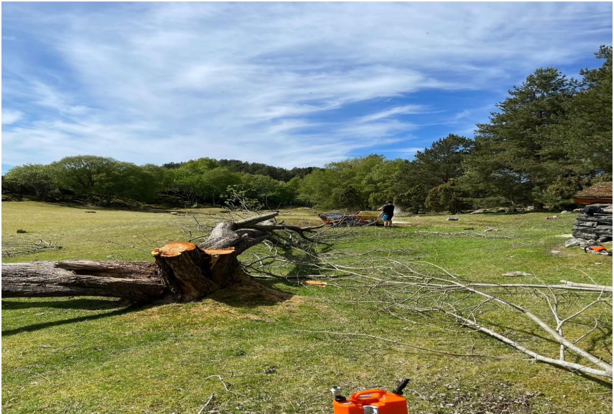
Fjerning og fresing av rotvelt på Vikholmen