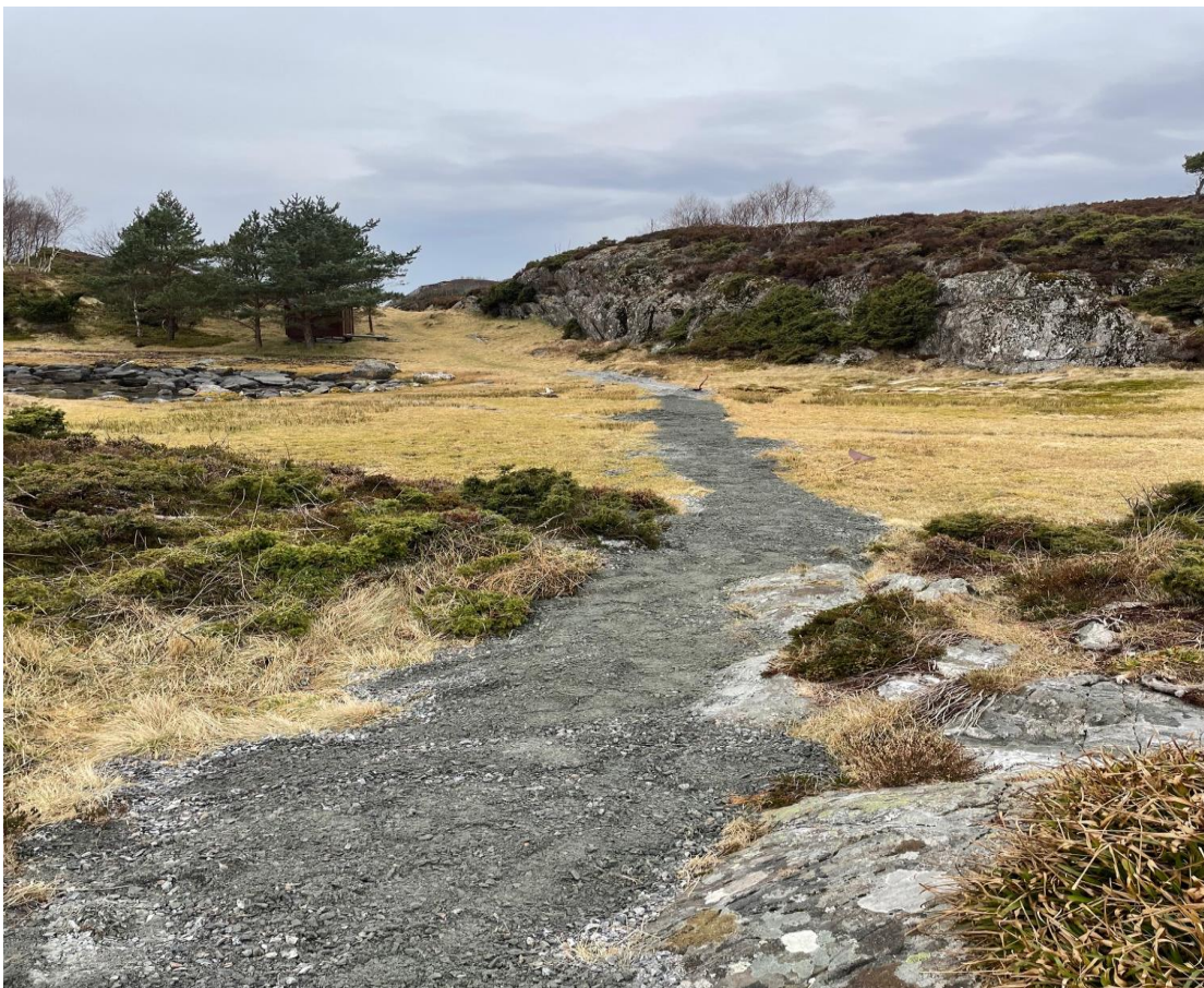
Grusing av sti på Storholmen

3.5.1 Rehabiliteringsprosjekt: Grusing av sti på Storholmen, Sula Rehabiliteringa er gjennomført som planlagt.