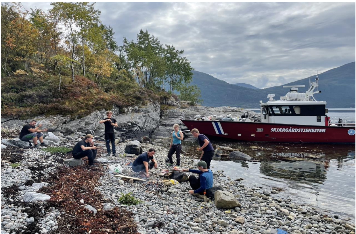
Arbeidsbåten Rigmor i aksjon.