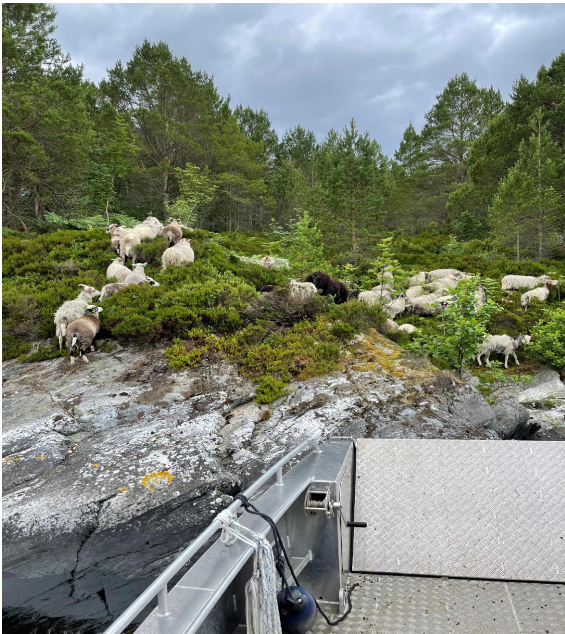
Utsetting av beitedyr

Vi bistår med frakt av dyrene. Og frakter ut mange dyr når våren kommer. Vi flytter rundt til flere holmer i løp av sommeren, etter beitetrykk og tilgang på mat, vi har ca. 250 dyr på sommerbeite på friareal som vi har ansvar for.