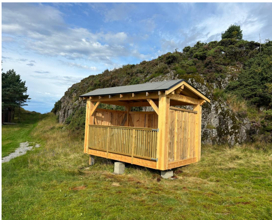
Bilde av nybygd gapahuk og bytting og utvidelse av landfeste på Storholmen.