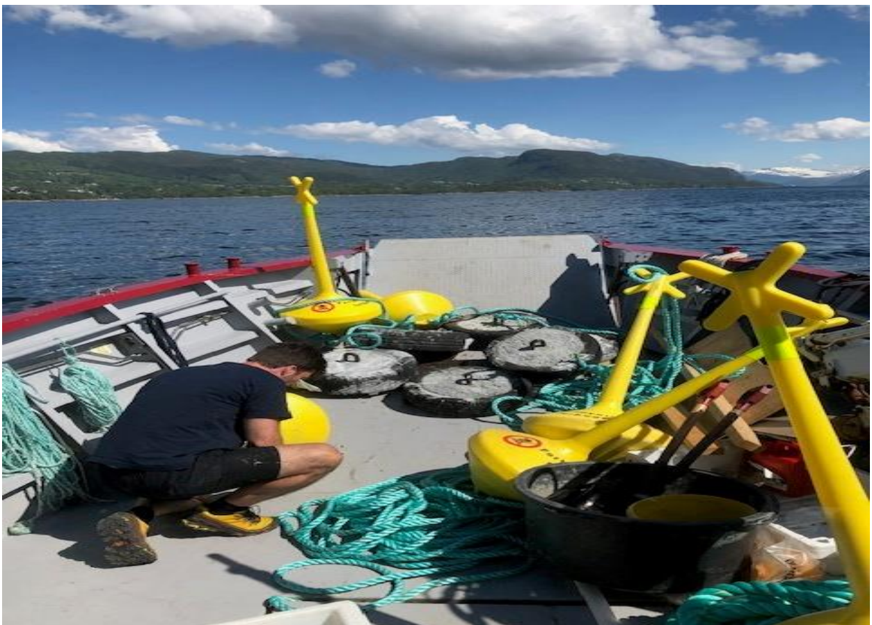
På vei til Kristiansund for utsett av nye badebøyer