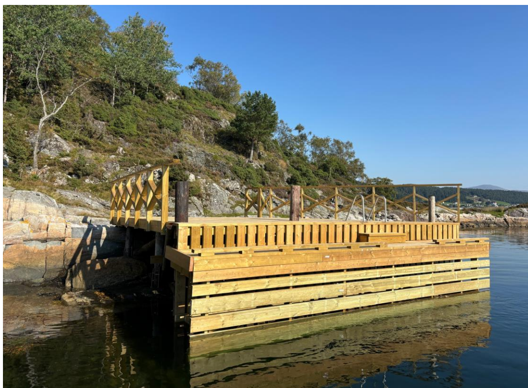
Rehabilitering av kai Vikholmen, Sunnmøre friluftsråd/Ålesund