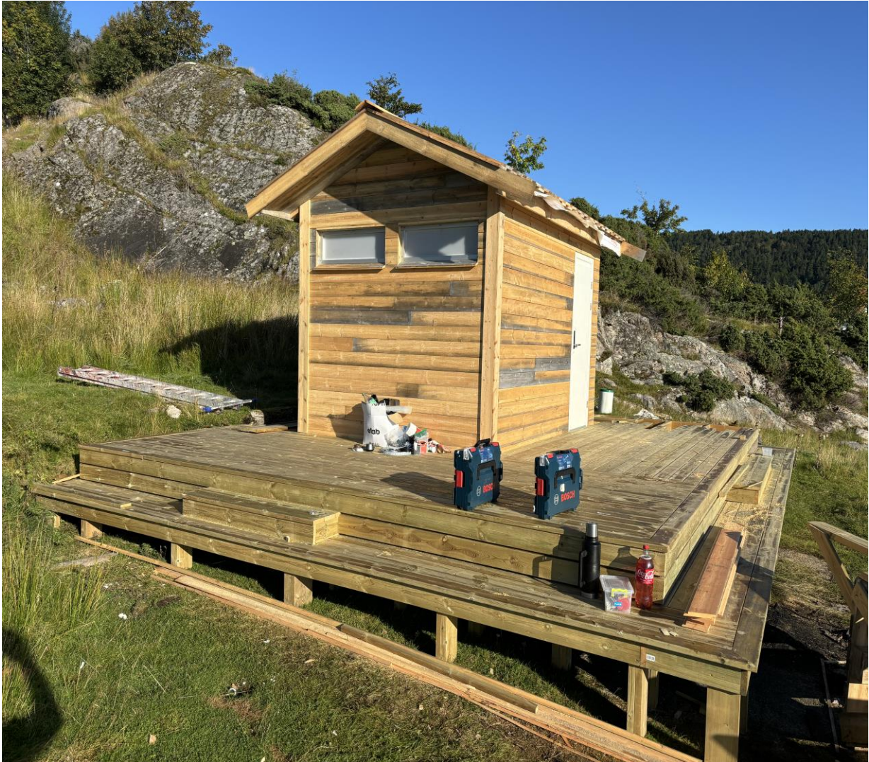
Bilde av nytt toalettbygg på øya Hundsvær i Borgundfjorden

Prosjektet er gjennomført etter planen etter bestilling fra Sunnmøre friluftsråd, jf. arbeidsplan.